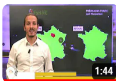
Info trafic en vidéo

A l'occasion de ces premiers départs en vacances, VINCI Autoroutes renforce son dispositif d'information trafic – que ce soit sur son site internet ou sur X – afin de permettre à chacun de planifier au mieux son trajet. Les équipes de Radio VINCI Autoroutes multiplieront également les points info trafic sur le 107.7, en lien avec les PC Sécurité et les Centres d'Information Trafic de Saint-Arnoult-en-Yvelines, Avignon et Cannes.