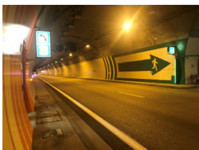
Maintenance dans les trois tunnels

Ce sont ainsi en tout 115 ventilateurs, 3 200 lampes et plus de 180 caméras qui seront vérifiés sur plus de 6 000 mètres de tunnels.