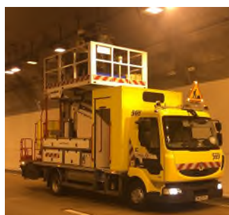
Vérification et remplacement de l'éclairage