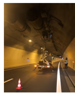
Vérification des ventilateurs