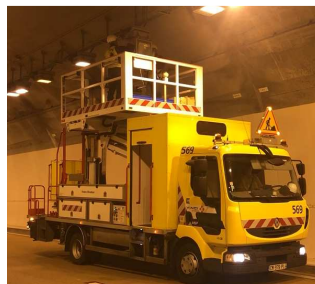
Vérification et remplacement de l'éclairage