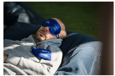
Espace Sieste Fondation VINCI Autoroutes

Ce vendredi 5 juillet marquera l'ouverture officielle de la saison estivale, avec le début des vacances scolaires. Comme l'a récemment rappelé une enquête réalisée par l'Ifop 1 , c'est en voiture que les trois quarts des Français qui ont la chance de partir en vacances voyageront cet été. Les jours de forts trafics, jusqu'à 4 millions de voyageurs par jour emprunteront ainsi le réseau VINCI Autoroutes. Tout au long de leurs trajets, ils pourront profiter de l'accueil et des nombreuses animations proposées par les équipes de VINCI Autoroutes et de leurs partenaires, afin de se détendre et faire des pauses réparatrices. Sur une quinzaine d'aires du réseau 2 , les vacanciers pourront ainsi retrouver, dans le cadre des Etapas #BienArriver , déployées les samedis et, selon les aires, les vendredis : des initiations à toutes sortes de disciplines sportives, des espaces conviviaux pour pique-niquer et/ou changer bébé, des électro-équipiers reconnaissables à leur gilet bleu... ainsi que des espaces de la Fondation VINCI Autoroutes regroupant, sur 10 aires 3 , une zone sieste, un stand prévention et une bibliothèque à ciel ouvert !