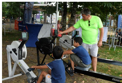
Aire de Romorantin/A85