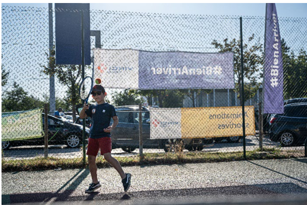
Initiation au tennis, Saint-Rambert/A7

Incontournables et plébiscitées par les vacanciers, l'invitation à la détente et l'initiation à des activités sportives sont aussi au rendez-vous sur les Espaces #BienArriver. Sur les espaces Détente, des coussins géants et des transats sont en libre accès pour reposer ses yeux, laisser son esprit vagabonder, faire le vide... avant de reprendre la route rasséréiné. Les plus actifs, prêts à se dépenser, comme les plus curieux, toujours à la recherche de nouvelles activités, pourront profiter des animations sportives déployées en plein air, en partenariat avec les Comités départementaux olympiques et sportifs : parcours aventure, tir à l'arc, judo, boxe, escrime... sans oublier les vélos à jus !