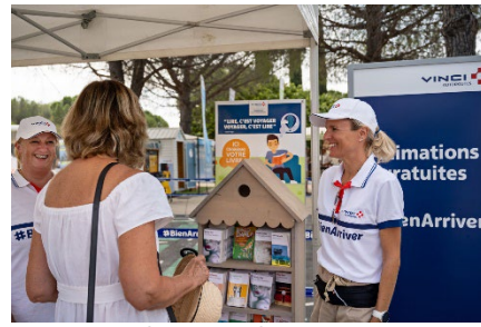
Accueil, Lançon-de-Provence/A7