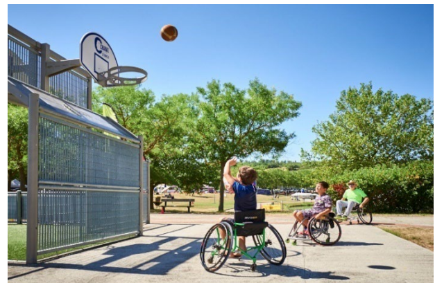
Découverte du handibasket, Port Lauragais/A61