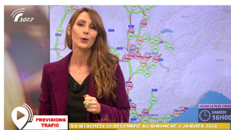
Info trafic en vidéo

A l'occasion de ces premiers départs en vacances, VINCI Autoroutes renforce son dispositif d'information trafic – que ce soit sur son site internet ou sur X – afin de permettre à chacun de planifier au mieux son trajet. Les équipes de Radio VINCI Autoroutes multiplieront également les points info trafic sur le 107.7, en lien avec les PC Sécurité et les Centres d'information trafic de Saint-Arnoult-en-Yvelines, Avignon et Cannes.