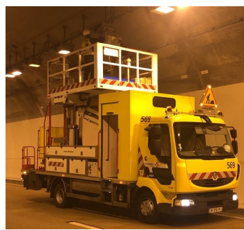
Vérification et remplacement de l'éclairage