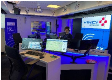
Studio de Radio VINCI Autoroutes