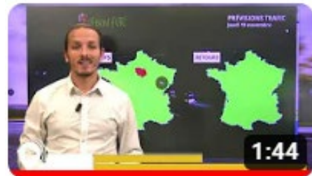
Info trafic en vidéo

A l'occasion de ces départs en vacances, VINCI Autoroutes renforce son dispositif d'information trafic – que ce soit sur son site internet ou sur X – afin de permettre à chacun de planifier au mieux son trajet. Les équipes de Radio VINCI Autoroutes multiplieront également les points info trafic sur le 107.7, en lien avec les PC Sécurité et les Centres d'information trafic de Saint-Arnoult-en-Yvelines, Avignon et Cannes.