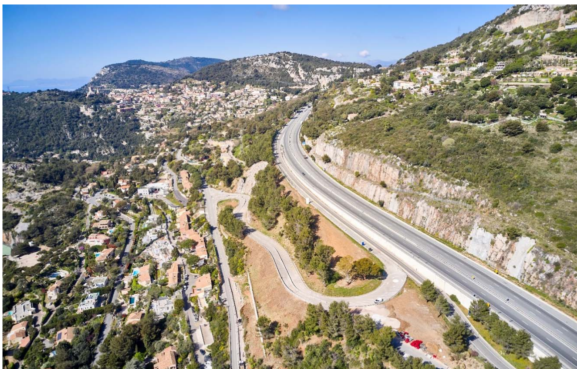
L'actuel site où va être construite la nouvelle sortie de Beausoleil

Ces travaux créeront ainsi un nouveau point d'échange entre l'autoroute A8 et le réseau départemental (RD 2564 - Grande Corniche), soulageant automatiquement les autres accès à Monaco (dont le tunnel de Monaco sur l'A500 et la Moyenne Corniche) et améliorant les conditions de circulation entre La Turbie et Menton.