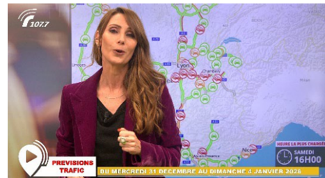
Info trafic en vidéo

A l'occasion de ce second long week-end du mois de mai, VINCI Autoroutes renforce son dispositif d'information trafic – que ce soit sur son site internet ou sur X – afin de permettre à chacun de planifier au mieux son trajet. La vidéo de prévisions trafic de Radio VINCI Autoroutes sera diffusée dès mardi 5 mai à 16h sur les bornes info trafic présentes sur les principales aires de services. Elle sera relayée sur la chaîne YouTube de Radio VINCI Autoroutes ainsi que sur le site de VINCI Autoroutes et son fil X dès 18h.