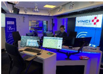
Studio de Radio VINCI Autoroutes