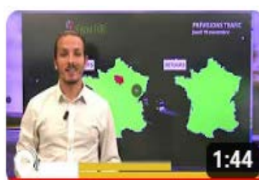
Info trafic en vidéo

A l'occasion de ces retours VINCI Autoroutes renforce son dispositif d'information trafic – que ce soit sur son site internet ou sur X – afin de permettre à chacun de planifier au mieux son trajet. Les équipes de Radio VINCI Autoroutes multiplieront également les points info trafic sur le 107.7, en lien avec les PC Sécurité et les Centres d'information trafic de Saint-Arnoult-en-Yvelines, Avignon et Mandelieu.