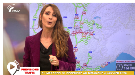
Info trafic en vidéo

A l'occasion de ces départs en vacances, VINCI Autoroutes renforce son dispositif d'information trafic – que ce soit sur son site internet ou sur X – afin de permettre à chacun de planifier au mieux son trajet. Les équipes de Radio VINCI Autoroutes multiplieront également les points info trafic sur le 107.7, en lien avec les PC Sécurité et les Centres d'information trafic de Saint-Arnoult-en-Yvelines, Avignon et Cannes.