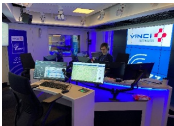
Studio de Radio VINCI Autoroutes