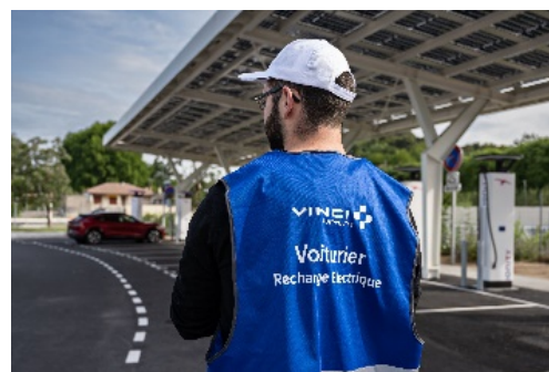
Gilet Bleu sur une aire

En collaboration avec la FFAUVE (Fédération française des associations d'utilisateurs de voitures électriques), Atlante, Avia Volt, Electra, TotalEnergies, Zunder et VINCI Autoroutes déploient, au cours des week-ends des vacances de Noël, un service gratuit de voituriers pour véhicules électriques. Sur 66 aires du réseau VINCI Autoroutes – dont 5 aires de repos proposant une station de recharge électrique – des experts mobilité électrique, reconnaissables notamment à leur gilet bleu (rouge pour les stations TotalEnergies), seront présents à proximité des bornes pour accueillir les conducteurs de véhicules électriques, les tenir informés lorsqu'un point de charge se libère pendant les périodes de pointe, les aider à stationner en toute sécurité et les assister lors de leur recharge.