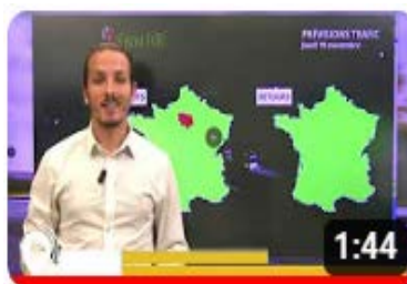
Info trafic en vidéo

Comme chaque week-end de fort trafic, VINCI Autoroutes renforce son dispositif d'information trafic – que ce soit sur son site internet ou sur X – afin de permettre à chacun de planifier au mieux son trajet. Les équipes de Radio VINCI Autoroutes multiplieront également les points info trafic sur le 107.7, en lien avec les PC Sécurité et les Centres d'information trafic de Saint-Arnoult-en-Yvelines, Avignon et Cannes.