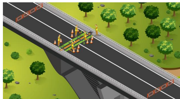
Remplacement des joints de chaussée